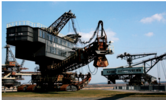
Die nächste Mitgliederversammlung der LAG Wittenberger Land findet am 7. Mai 2009 in der „Stadt aus Eisen“, in Ferropolis statt.