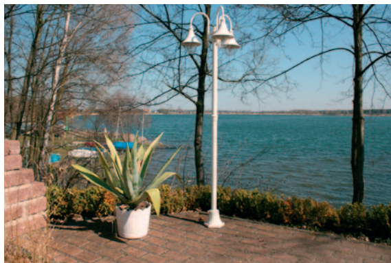
Bergwitzsee: Die Flutung des Tagebaus Mitte der 1960er Jahre stand am Beginn der heutigen Seenlandschaft im früheren Braunkohlengebiet.

Zwischen der Lutherstadt Wittenberg und Bitterfeld-Wolfen, wo über ein Jahrhundert hinweg Braunkohle abgebaut wurde, erstreckt sich heute eine Seenlandschaft. In den Bergbaufolgegebieten ist in den zurückliegenden 15 Jahren eine vielfältige touristische Infrastruktur – vor allem mit attraktiven wassersportlichen Freizeitangeboten – entstanden. Nun soll die gemeinsame Vermarktung der Seenlandschaft in Angriff genommen werden. Dies wird in enger Zusammenarbeit mit dem Projekt „Blaues Band“ in Sachsen-Anhalt erfolgen. Das Thema zählt auch zu den Aufgaben des ILEK für den Landkreis Wittenberg. Ziel des Projektes ist die Entwicklung eines einheitlichen, abgestimmten