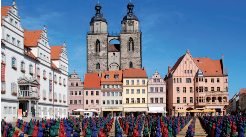
Kunst-Aktion bringt Imagegewinn für Wittenberg: Die Installation „Martin Luther: Hier stehe ich ...“ des Künstlers Ottmar Hörl hat weit über Deutschlands Grenzen hinaus Aufmerksamkeit gefunden. Über 700 der insgesamt 800 Luther-Figuren sind nach Abschluss der Aktion an Käufer verschickt worden, darunter an Interessenten in Australien, Dubai und Brasilien. Die Lutherstadt nimmt auch im Integrierten Ländlichen Entwicklungskonzept (ILEK) eine herausgehobene Stellung ein. www.wittenberg.d