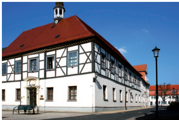
Die Kommunen des Städtebundes Dübener Heide (Foto: Gräfenhainichen, Rathaus) wollen sich bis zum Jahr 2020 als energieautarke Region etablieren.

Der Landkreis Wittenberg gehört neben der Region Elbe-Elster (Brandenburg) zu den Modellgebieten, in denen Re-Produktionsketten für die Wasser- und Energieinfrastruktur in schrumpfenden Regionen untersucht werden. Das Bundesministerium für Bildung und Forschung (BMBF) finanziert das Projekt im Rahmen der Fördermaßnahme „Nachhaltiges Landmanagement“. Hintergrund: Stark sinkende Bevölkerungszahlen verteuern den Betrieb zentraler technischer Infrastrukturen. Ein bis zwei regionale Re-Produktionsketten sollen im Zuge des Vorhabens so weit vorangetrieben werden, dass sie organisatorisch tragfähig und mit konkreten Finanzierungsoptionen versehen sind. Welche das sein können,