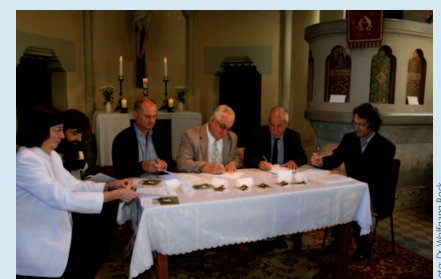
Am 15. 9. 2010 wurde in der Kirche zu Stumsdorf die Kooperationsvereinbarung von Vertretern der Kirchenkreise und den LAG-Vorsitzenden unterzeichnet.